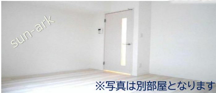
※写真は別部屋となります