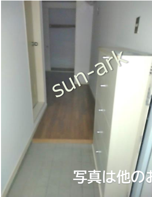
写真は他のお部屋です

神田川に近い本物件は、春になると遊歩道にこぼれんばかりの桜が圧巻です♪ FamilyMart 約50m他コンビニ複数近隣 東中野駅ビル隣接のアトレには、成城石井を始めとしたお店があり生活至便♪