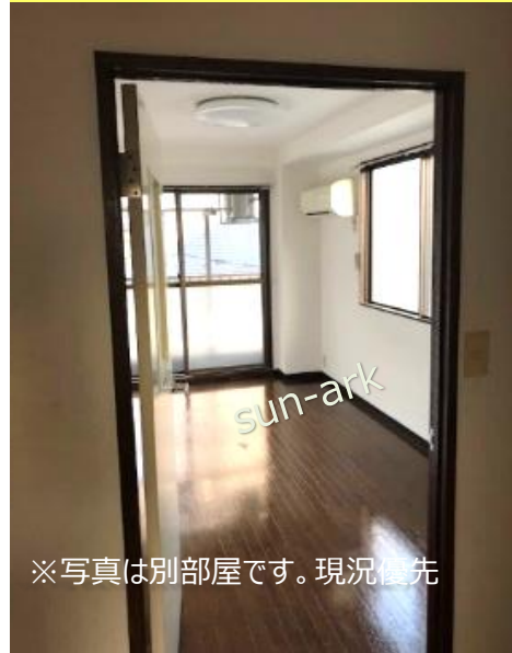
※写真は別部屋です。現況優先

ファミリーマート早稲田大学店 約100m他コンビニ複数周辺有り 早稲田大学、学習院女子大学近隣