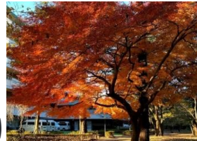
↑「江古田の森公園」近隣 お散歩に最適です

公園・妙正寺川近隣の閑静な住宅地、 まいばすけっと 約200m、中央動物病院 約250m 中野江古田病院・総合東京病院 約400m 生活環境良好♪