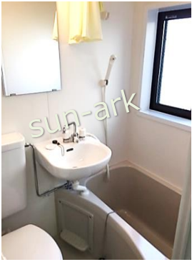
写真は前回のものです