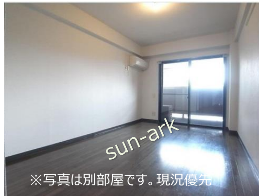
※写真は別部屋です。現況優先